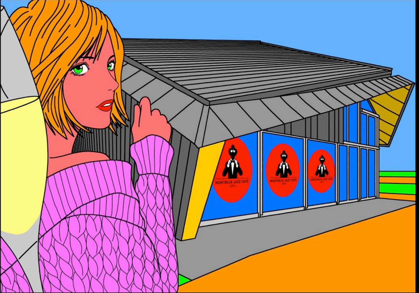
LE MONTREUX JAZZ CAFE